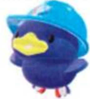
西建設キャラクター「にっしー君」