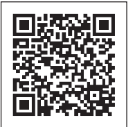
当院スケジュール画面