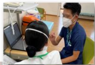
マンツーマン指導