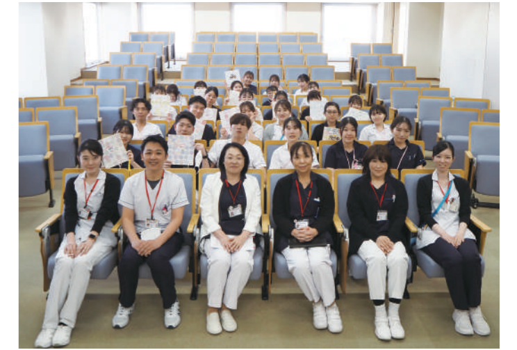
2024年3月 新人卒業の会(新人看護師研修)