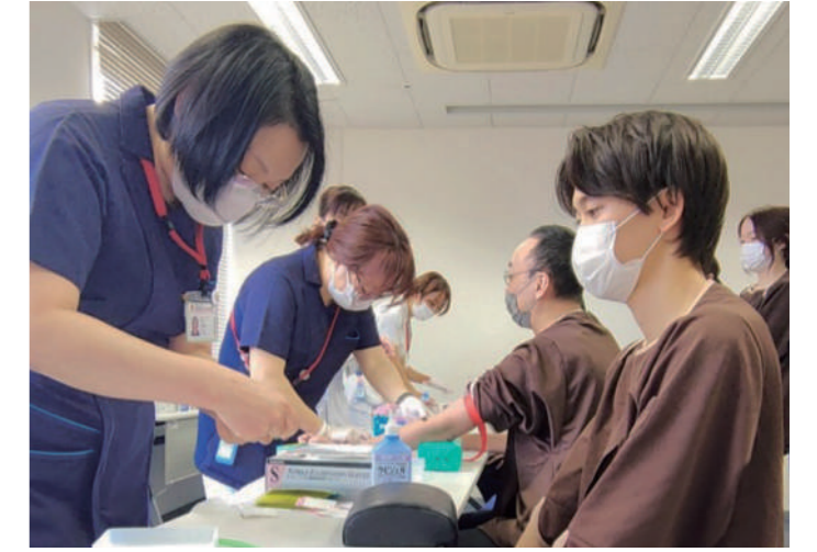
2024年4月 職員健診では自ら採血を担当