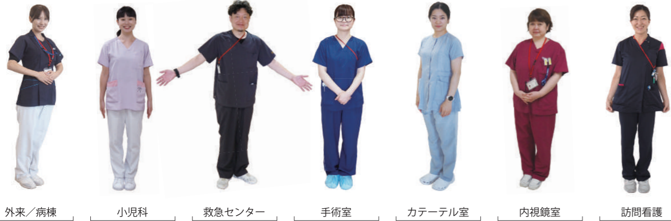
外来/病棟 小児科 救急センター 手術室 カテーテル室 内視鏡室 訪問看護