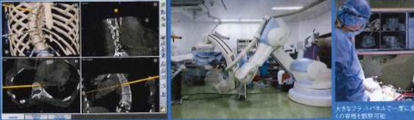
手術中、5-6月の撮影で立体画像が得られる