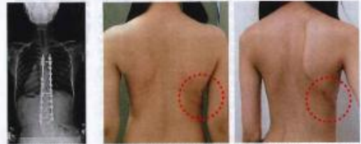
脊椎側彎症の診断に力を入れている